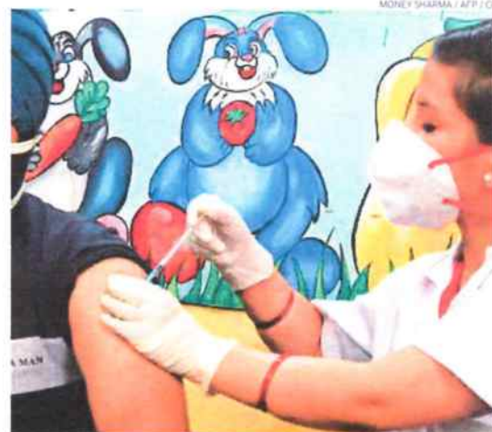
Pais tem apenas 4% de 1,1 bilhão de adultos completamente imunizados

“O laser aerotransportado conseguiu derrubar vários drones a uma altura de 900 metros e um raio de 1 quilômetro. Mas, uma vez aperfeiçoado, poderá interceptar alvos em um raio de 20 km”, explicou Rotem em uma videoconferência. “Essa tecnologia, desenvolvida pelo Ministério da Defesa e pela empresa israelense Elbit Systems, utiliza técnicas de detecção aérea do Exército e, em seguida, impulsiona um laser de 100 quilowatts na direção do alvo”, acrescentou. Um protótipo operacional pode ficar pronto “em três ou quatro anos”, segundo ele. “O sistema de laser possibilitará enfrentar uma série de ameaças, dando segurança ao Estado de Israel e ao mesmo tempo reduzindo os custos de interceptação”, afirmou em nota o ministro da Defesa, Benny Gantz.