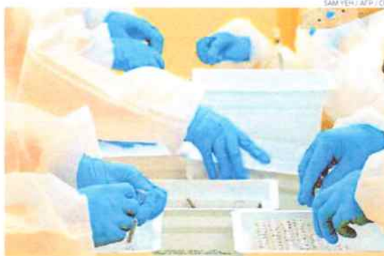
Consórcio para a produção de doses é liderado pela Afrigen e Biovac

Ainda na coletiva, o presidente da África do Sul, Cyril Ramaphosa, reforçou a importância de mudar a narrativa do continente como “centro de doenças e pobreza em desenvolvimento”. “Criaremos uma narrativa que celebra sucesso contra o fardo da doença, (uma história) de independência e de avançado desenvolvimento sustentável”, frisou. Nos países norte-africanos, mais desenvolvidos, metade dos cidadãos estão vacinados, de acordo com Ramaphosa. “Nós, no Sul, ainda estamos sofrendo com a falta de acesso a vacinas”, acres-