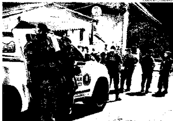
Brigadistas patrulharam vários bairros de Porto Alegre durante a ação.

Numa das abordagens, na Vila Maria da Conceição, bairro Partenon, na zona Leste, local com histórico de disputas violentas pela hegemonia no tráfico de