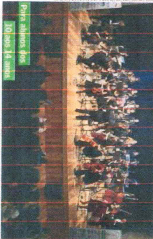
Para alunos dos 10 aos 14 anos

A Orquestra Jovem do Rio Grande do Sul (OJRS) está com processo seletivo aberto para o ingresso de novos alunos, na faixa etária dos 10 aos 14 anos. São 30 vagas disponíveis para quem sorria em fazer parte de um projeto social que, há 14 anos, transforma a vida de crianças e jovens por meio da música. Muitos deles seguiram a carreira musical e hoje estão dando aulas – inclusive na própria OJRS. As inscrições estão abertas até 31 de outubro, são gratuitas e podem ser feitas pelo formulário disponível em trjurl.com/ogs2023 . Acessando o site da Orquestra Jovem ( orquestrajovemrs.com.br/ ), é possível baixar o edital para iniciantes e se inscrever preenchendo o formulário online, além de obter mais informações. Para participar do processo seletivo, os candidatos devem estar matriculados e frequentando aulas no turno da manhã em escolas da rede pública ou particular (desde que tenham bolsa de estudos) e com renda familiar mensal de até três salários mínimos. As aulas ocorrem à tarde, na Fundação Pão dos Pobres, no bairro Cidade Baixa, na Capital. Aos alunos selecionados e que ingressarem na OJRS serão fornecidos material pedagógico, instrumento, uniforme, lanche e transporte. Criada em 2009, a Orquestra Jovem do RS tem foco na formação musical de excelência, voltada ao atendimento de crianças e adolescentes de baixa renda e integrantes da rede escolar.