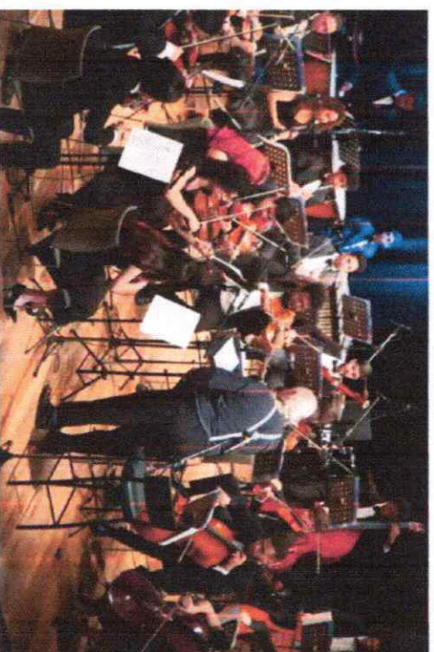
Imagem: Renato Naves