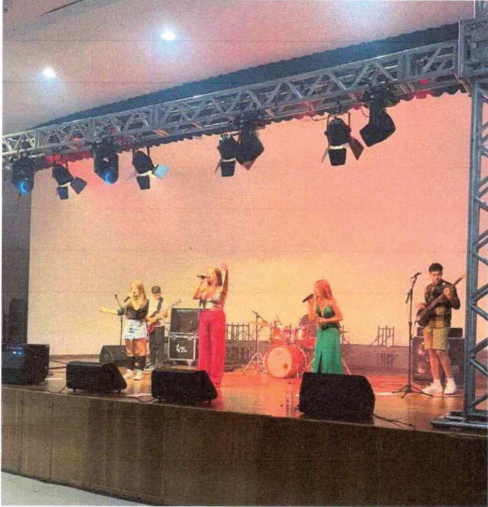
GRAMADO/RS – INICIO ESCOLAS MUNICIPAIS – 2023