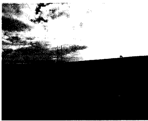
Figura 3 - Fim da futura avenida

A Contratada deverá disponibilizar, durante o prazo de execução dos serviços, equipes conforme abaixo discriminado: