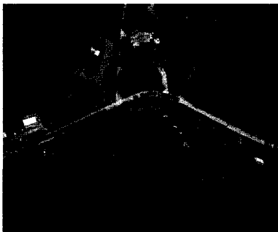
Início no final da pavimentação existente, Rua Sertão Capivara – Etapa 2

As medidas de Largura e Extensão deverão ser conferidas no local e poderão sofrer alteração em caso de necessidade.