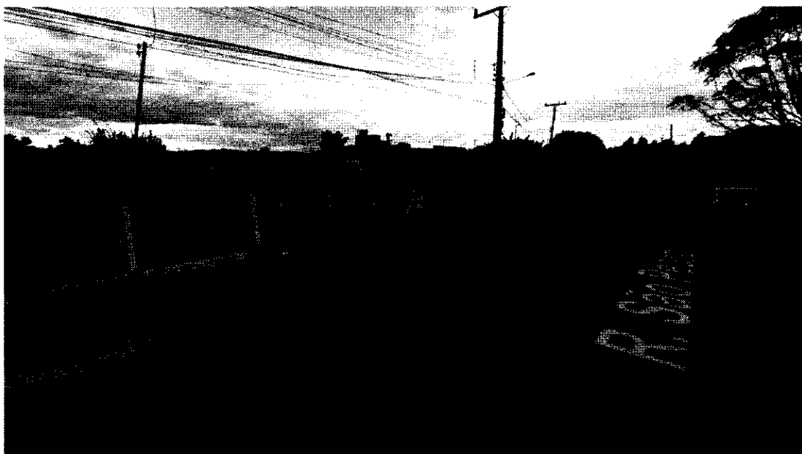
Figura 2 - Início da drenagem