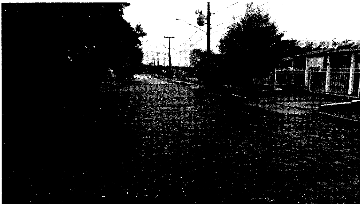
Figura 4 - Rua Buriti esquina com Rua Plátano