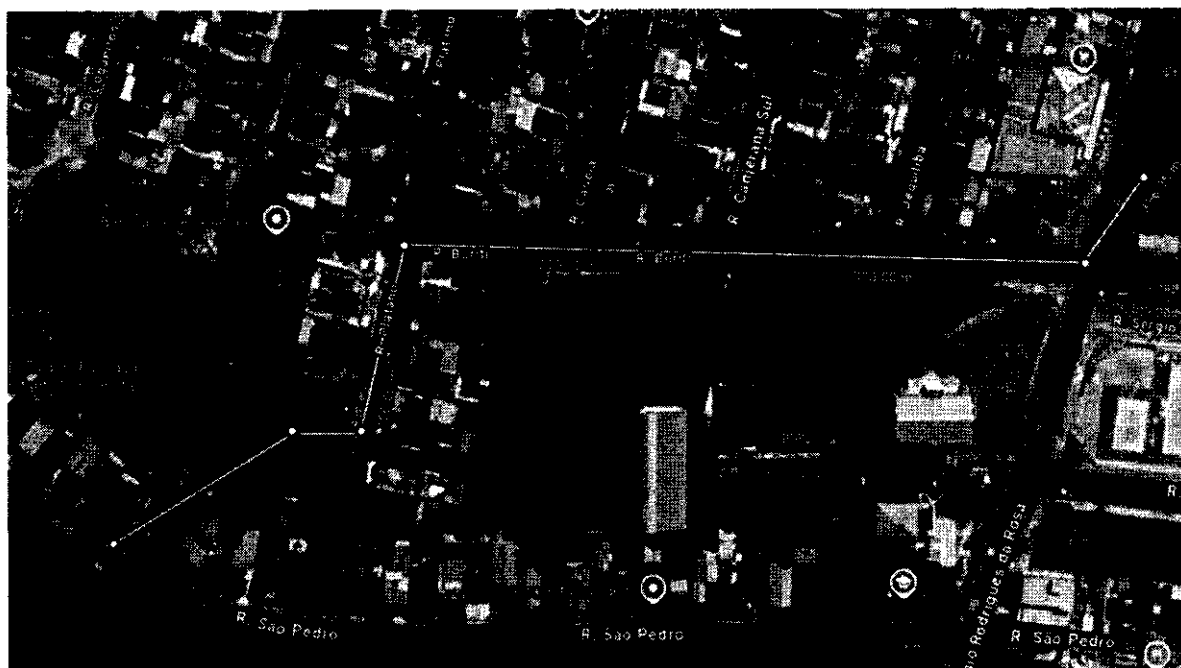
Figura 1 - Percurso que contemplará a nova drenagem