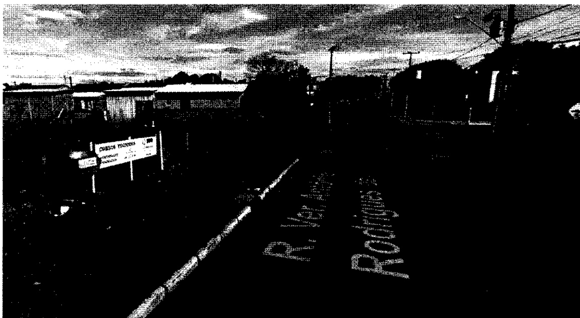
Figura 6 - Final da Drenagem na Rua Vereador Antônio Rodrigues da Rosa