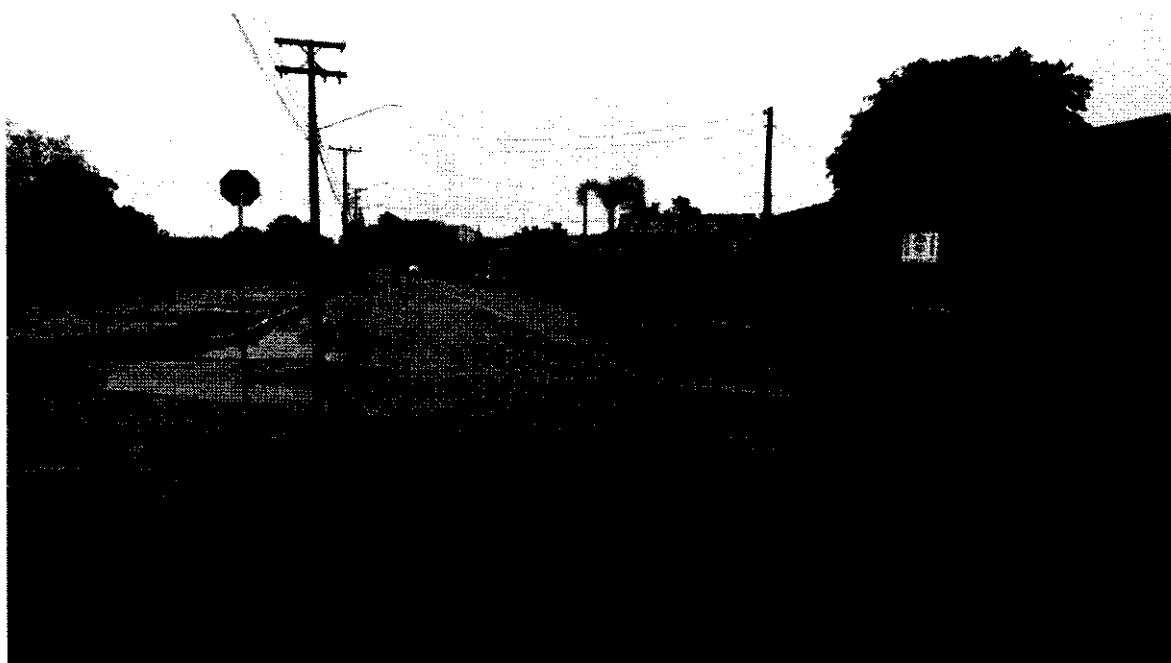
Figura 5 - Rua Buriti esquina com Rua Vereador Antônio Rodrigues da Rosa