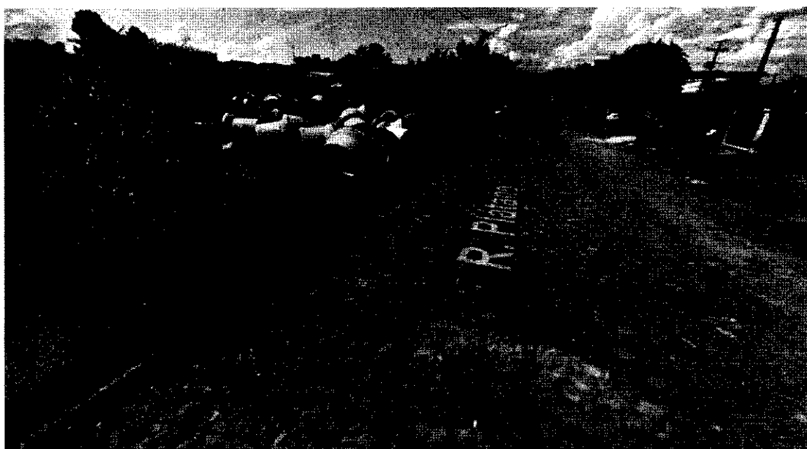
Figura 3 - Rua plátano